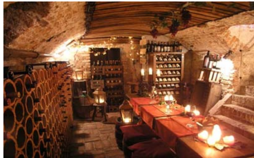
Der Weinkeller im Falderhof

Ein überaus charmanter Veltliner und unbestritten einer der ganz Großen in der Wachau und ganz Österreich. Was Franz Hirtzberger Jahr für Jahr auf die Flasche bringt, ist wirklich beeindruckend. Vollreif und dennoch erfrischend und belebend - und mit der typischen, kühlen Würze der Grünen Veltliner aus Spitz. Das Rote Tor Federspiel gehört zu den beständigsten und besten Weinwerten des Landes.